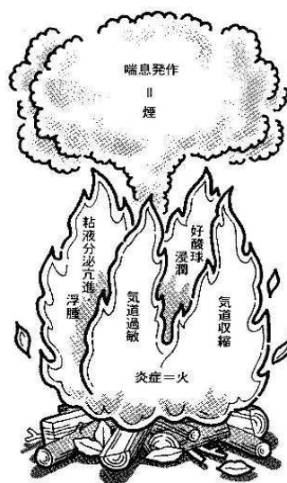
■喘息発作をたき火で表すと

薬を適切に使って火を弱めながら、根本の原因である燃えるタキギを取り去ればよいのです。取り去るのを可能にするのはみなさんが持つ「自然治癒力」と「根本治療」の力です。 この二つの力によって、慢性的な気道の炎症をとめるだけでなく、気道の「リモデリング」を防ぎ、喘息をよくし、治していくことが可能になるのです。